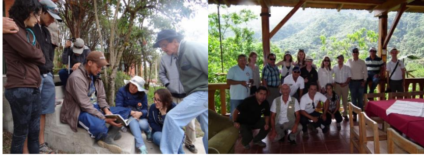
Natural History Students Learning about the Rainforest at Jocotoco Reserves.