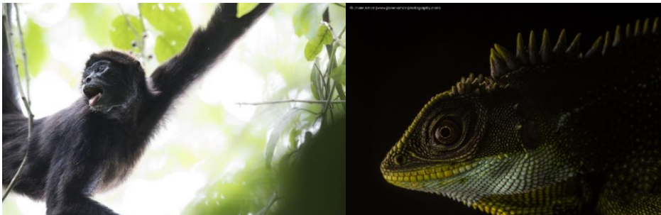
Critically Endangered Coastal Spider Monkey Rainforest Iguana