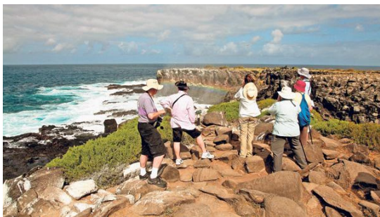
Visitors walking along spectacular cliffs overlooking the ocean.

Viajaremos al lado opuesto de la isla para realizar snorkel, observación de aves marinas y caminatas de observación en Puerto Chino. En el camino visitaremos el volcán Junco (el punto más alto de la isla) con un lago de agua dulce, para finalmente visitar el Centro de Reproducción de Tortugas